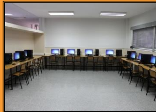
Aula de Informática