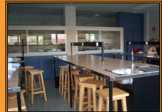
Laboratorio de Ciencias

-Biblioteca -Oratorio -Taller de Tecnología y Educación Plástica -Aula de Música -Aula de Logopedia y Compensatoria -Salón de Actos