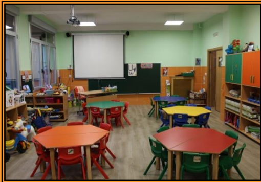
Pizarras Digitales Interactivas (PDI)