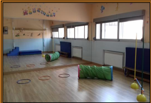
Sala de Psicomotricidad