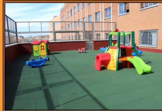
Patio propio para Ed. Infantil